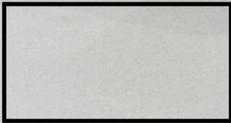
The Treasury, Yesterday